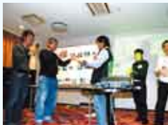
年間大物賞の表彰式です。