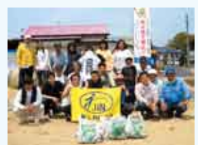
牛窓海水浴場大清掃作戦。JSBCではこういう活動も積極的にっております。