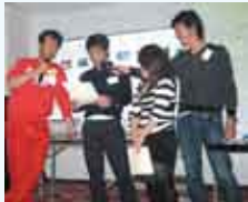
我が会長「風林火山」の赤色甲冑ならぬ赤色衣装で、大物賞受賞者にインタビュー。

ジンスモールボートクラブ（JSBC）では、各種のトラブルを防ぎ、皆様と共に楽しく明るく海のレジャーを楽しむよう努力を致しております。